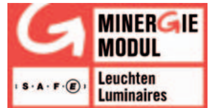
Bild 10 Das Erkennungszeichen des neuen Minergie-Moduls Leuchten.